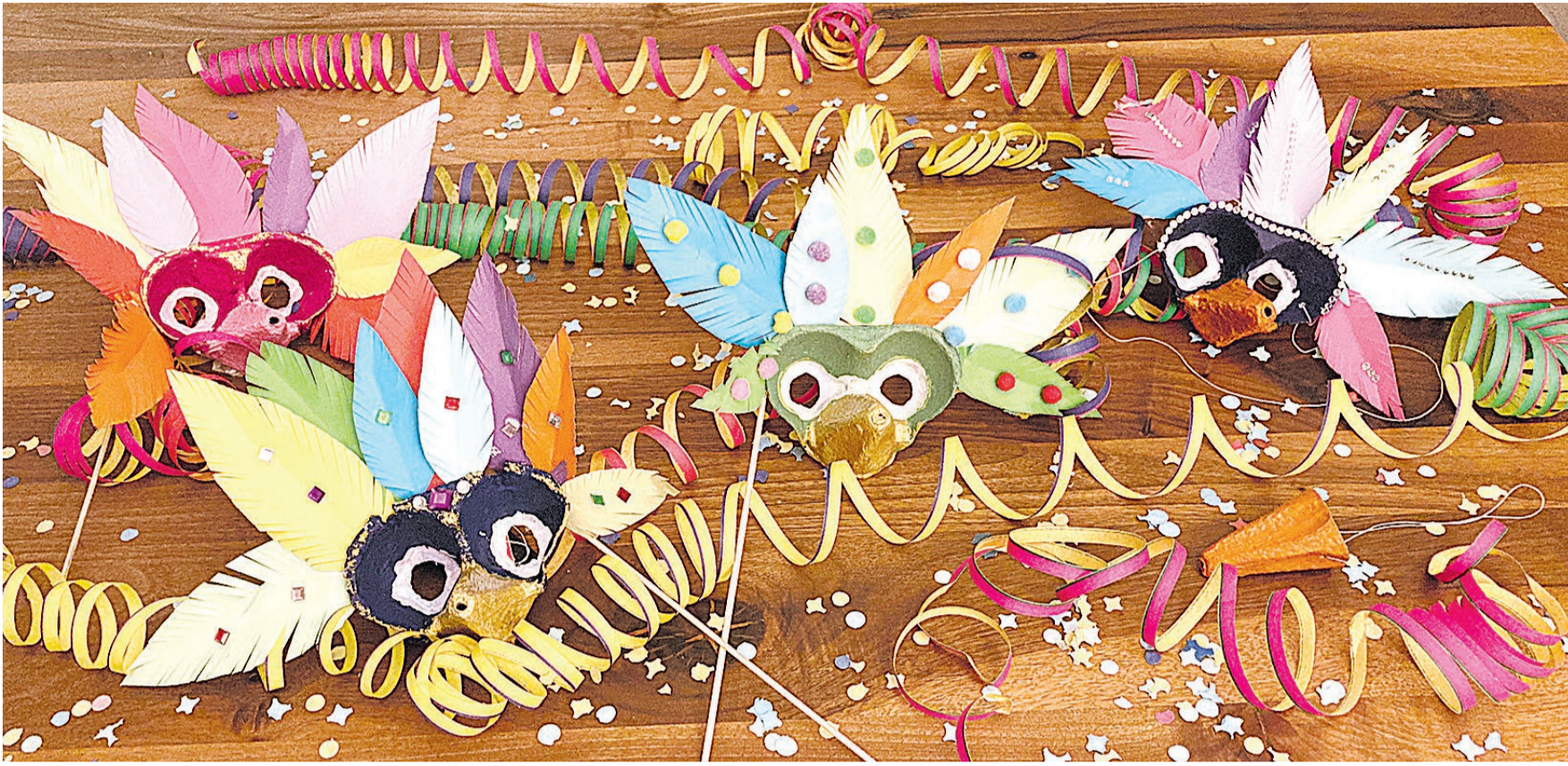
Aus zwei Eierbechern und einem Trenner wird eine dekorative Augenmaske, die fantasievoll gestaltet werden kann.